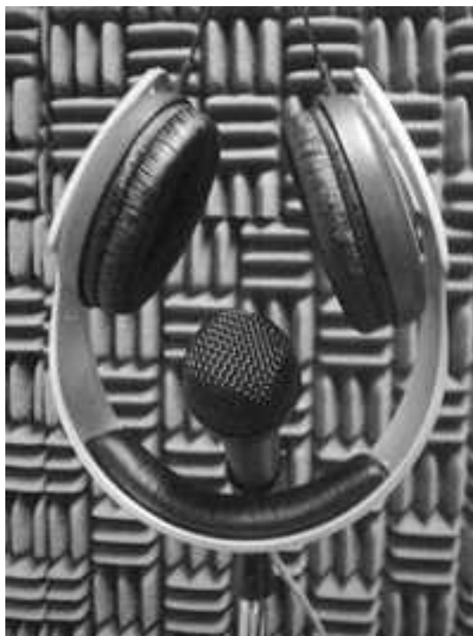
Cabina de Radio Universidad de Guadalajara. Autor: Cecilia Duran.

“La meta primordial (de las estaciones de radio universitarias) es dejar de ser un medio de universidad para convertirse en un medio Universal hacia la sociedad.”